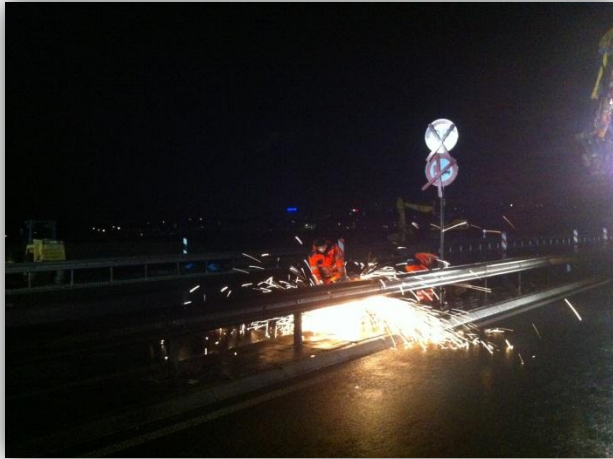
Eindrucksvolle Baumaßnahmen bei Nacht während einer der Wochenendsperrungen der A60. Hier wird die Mittelleitblanke aufgeschnitten und entfernt.