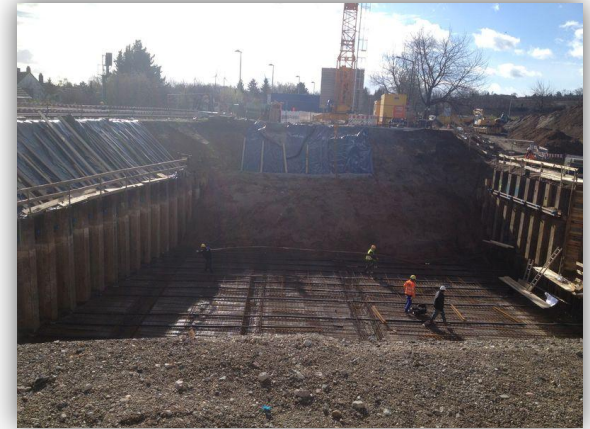
Die Tiefe dieser Baugrube am Bahnhof ist erforderlich, damit die Straßenbahn später durch die Unterführung unter den Bahngleisen fahren kann.