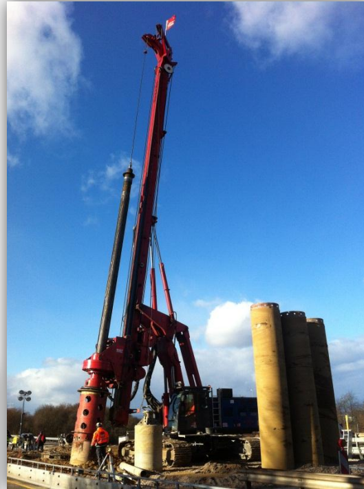
Dieser Spezialbohrer hat im Zuge der Brückenbauarbeiten über die A60 zehn Pfeiler mit je 30 Meter Länge schräg in den Boden gebohrt.